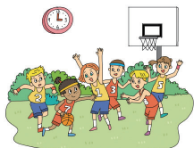
↳ 2시간 전에 시작